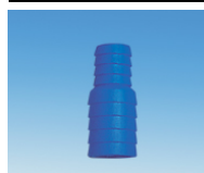
Entlüftungsstutzen / vent connection C1.0605.01