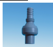
Rückschlagventil mit Entlüftung / non- return-valve with venting 3004.53.00