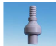
Rückschlagventil / non-return-valve 3004.02.00