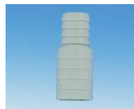
Schlauchstutzen / hose clip C1.0608.02