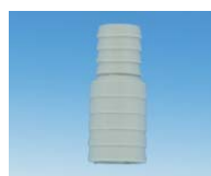
Schlauchstutzen / hose clip C1.0608.02