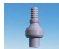
Rückschlagventil / non-return-valve 3004.02.00