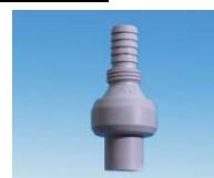
Rückschlagventil / non-return-valve 3004.02.00