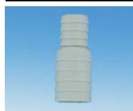
Schlauchstutzen / hose clip C1.0608.02