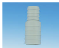
Schlauchstutzen / hose clip C1.0608.02