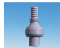
Rückschlagventil / non-return-valve 3004.02.00