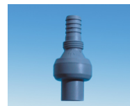
Rückschlagventil mit Entlüftung / non- return-valve with venting 3004.53.00