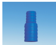
Entlüftungsstutzen / vent connection C1.0605.01